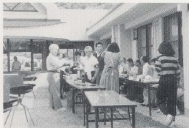
ふれあいの里訪問・交流