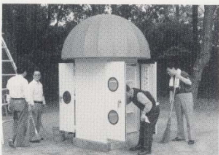
京都府植物園 こども文庫「きのこの家」清掃