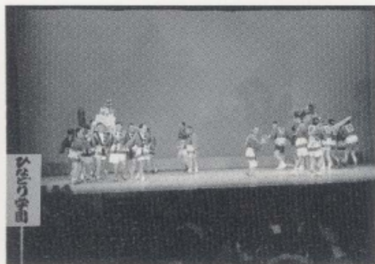
第24回精神薄弱児者施設学習発表会