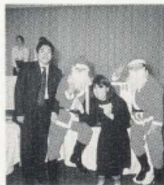
ラッキーカード抽選