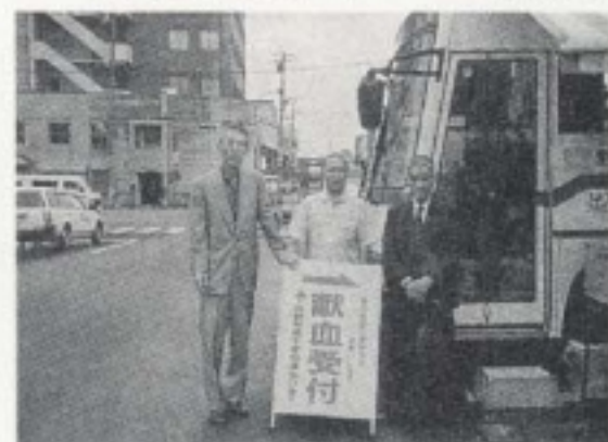
9月28日(月) 第一回街頭献血 於:中央市場駐車場