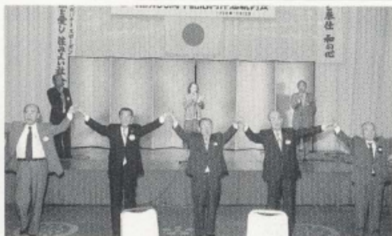
楽しく輪になって平安の絆を