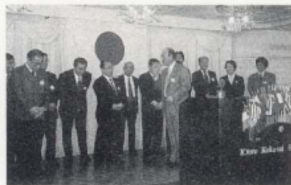
L岩佐より次期役員・理事のご紹介