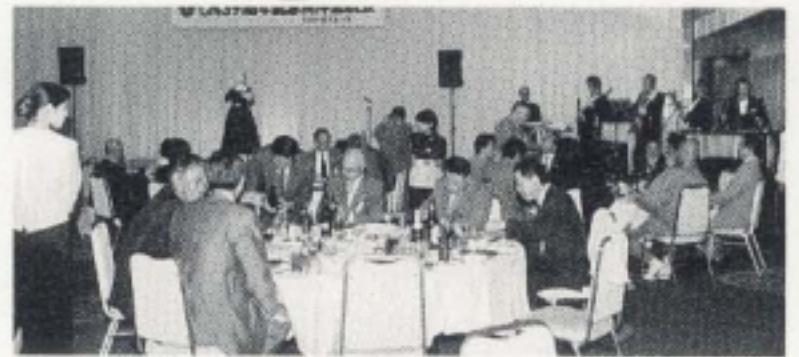
楽しい懇親の一刻