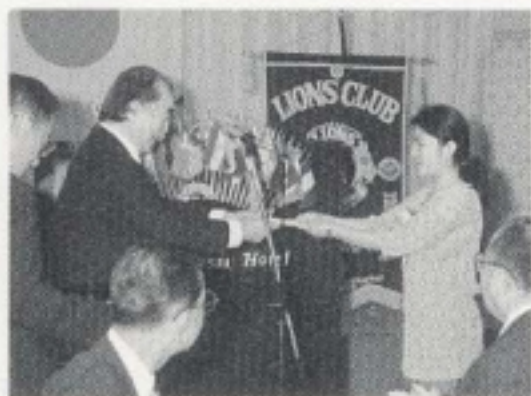
平成10年度奨学生 張さん、朴さん、がんばってください