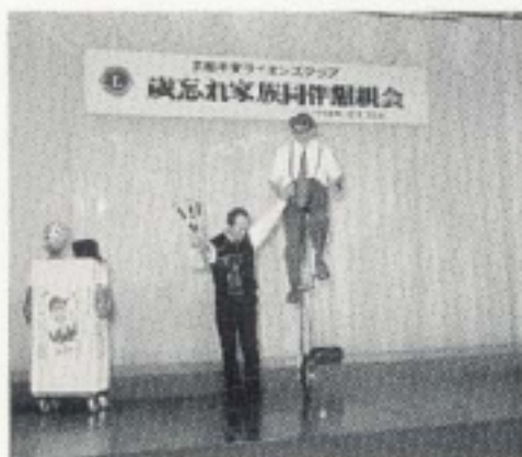
アトラクション 「ストリートパフォーマンス」