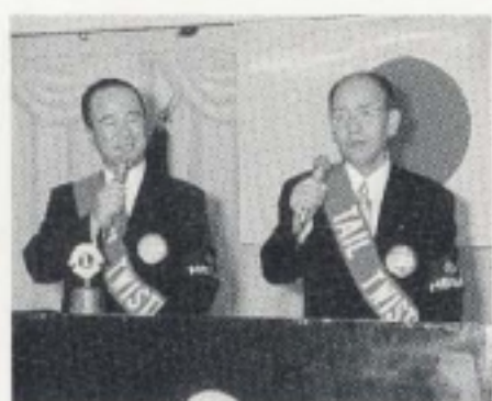
T. T. L. 新谷・L. 井辻 凸凹コンビ結成