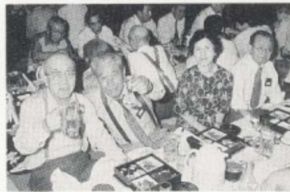
仲良く同伴懇親楽しい食事