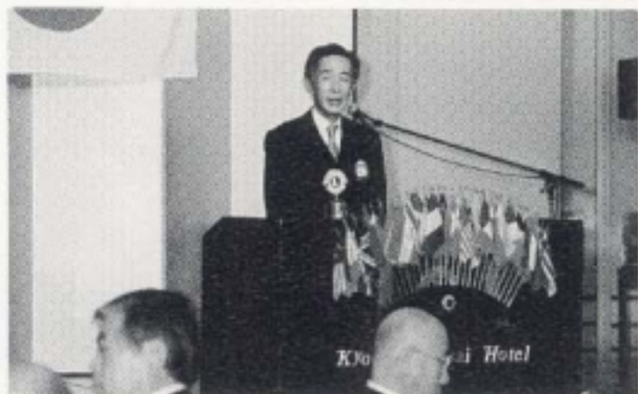
副地区ガバナー L西川ご祝辞