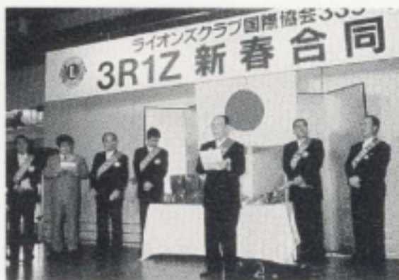
全クラブテールツイスターによる YES NO クイズ