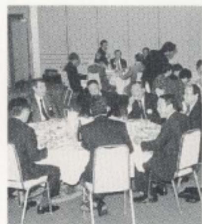
楽しく会食楽しい懇親