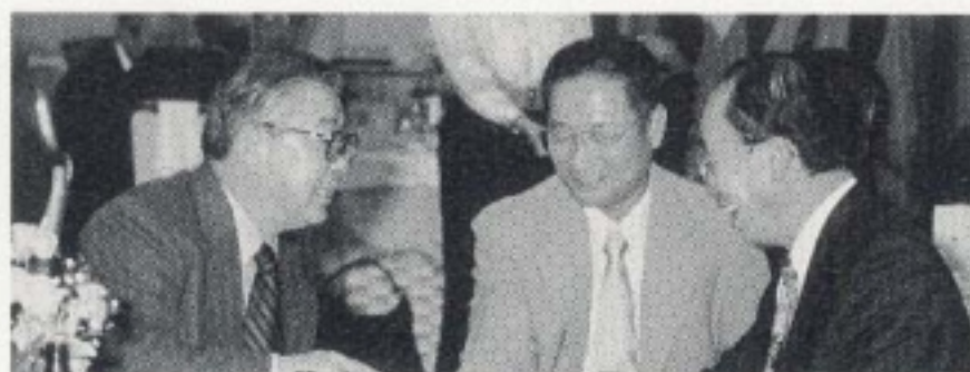
何か知らぬが楽しそう!