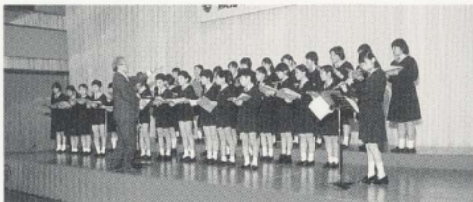
京都市少年合唱団によるオープニング合唱