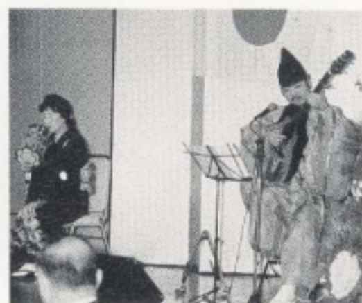
ギターと鼓による和歌の調べ