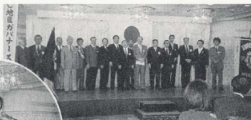
次期役員・理事発表