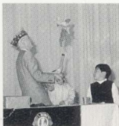
京都紫明LCマジック同好会 のマジックショー