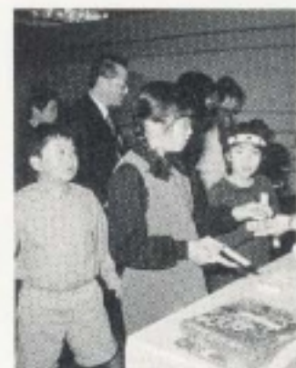
子供達に夜店の雰囲気 で楽しい一刻