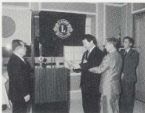
サッポロビール㈱京都支社長 L井内入会式