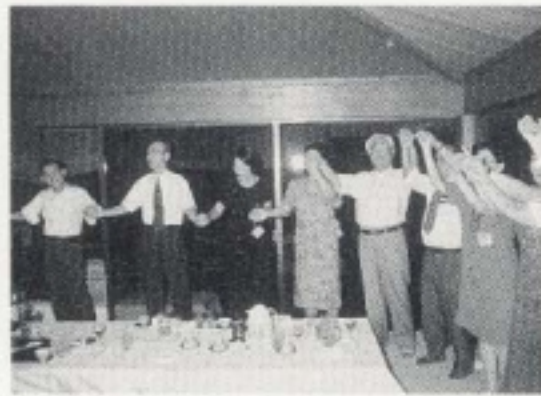
ABCの会場で各々 輪になって「また合う日まで」