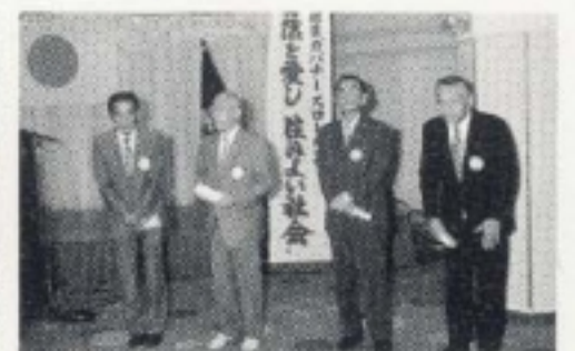
335-C地区へ出向された方々への感謝