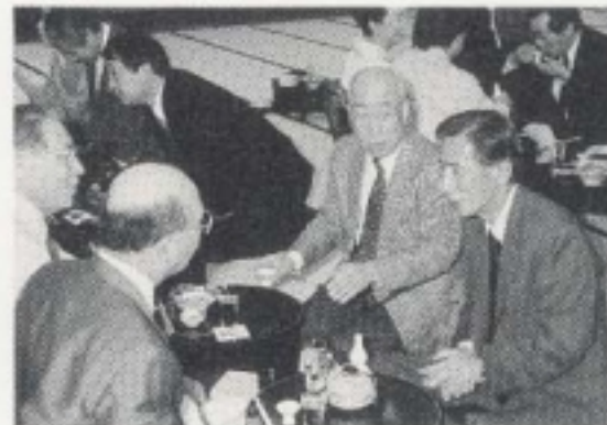
改築した左阿彌にて 副地区ガバナーを囲み楽しく懇親の一刻