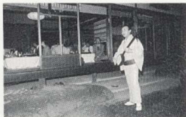
枝幸太夫の新内流し 泉川邸マッチして一層盛上がる