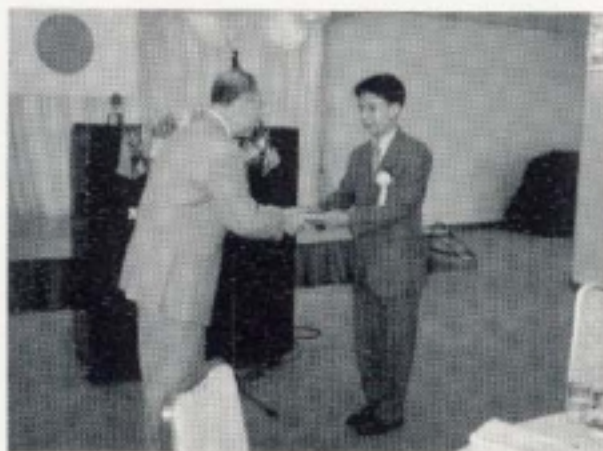
外国人留学生奨学金給付