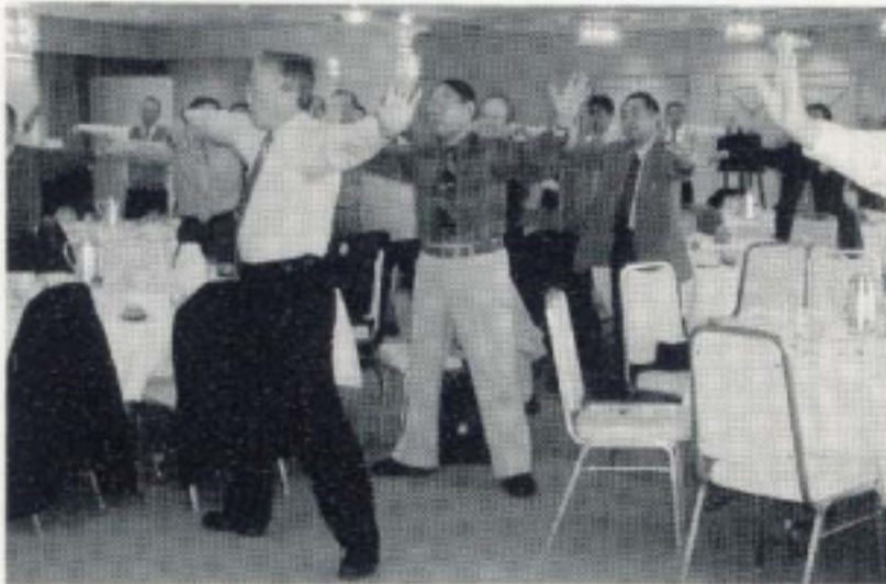
元太極拳日本チャンピオンからメンバーもご指導を受けました。 (2月第二 次期役員・理事指名・健康)