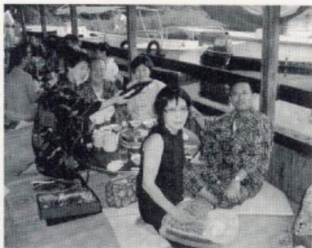
瀬田川、あみ船での楽しい懇親会。