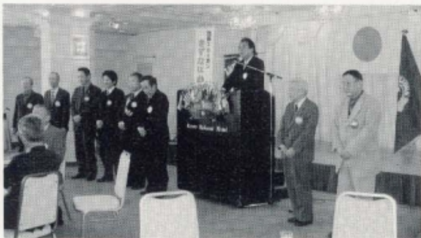
次期役員の皆様、どうぞ宜しくお願いいたします。 (3月第一 次期役員・理事選挙)