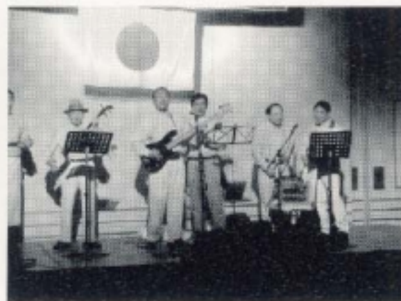
5クラブ正副T・T グリーンウォーター ブラザーズによる生バンド? 演奏?。