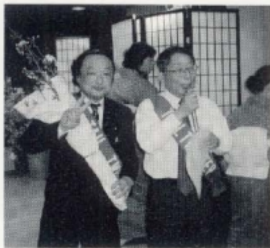
テールツイスター登場 カラオケ歌合戦のはじまり～ はじまり～ (4月第一 宇治LCとの合同懇親お花見)