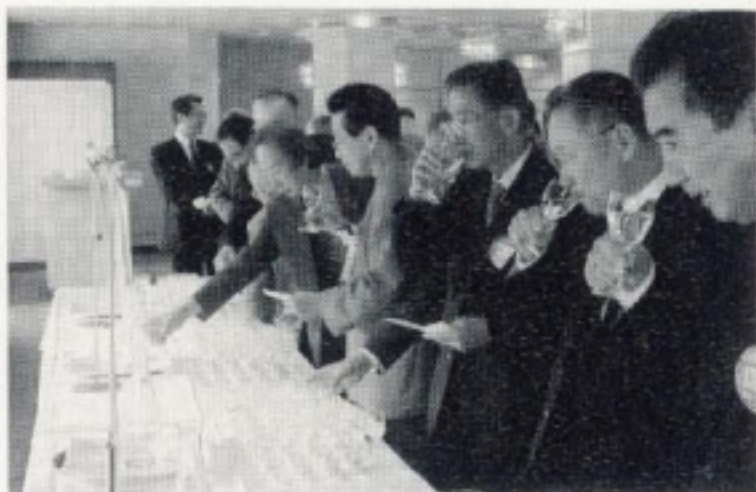
利き水に挑戦!! 違いがわかるかな? (11月第一)