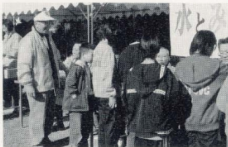
大勢の児童の参加に小山会長大喜び? (11月第二 水とみどりのライオンズデー ACT)