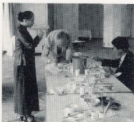
ビジターにもご参加いただいて お皿に絵付けをしました。