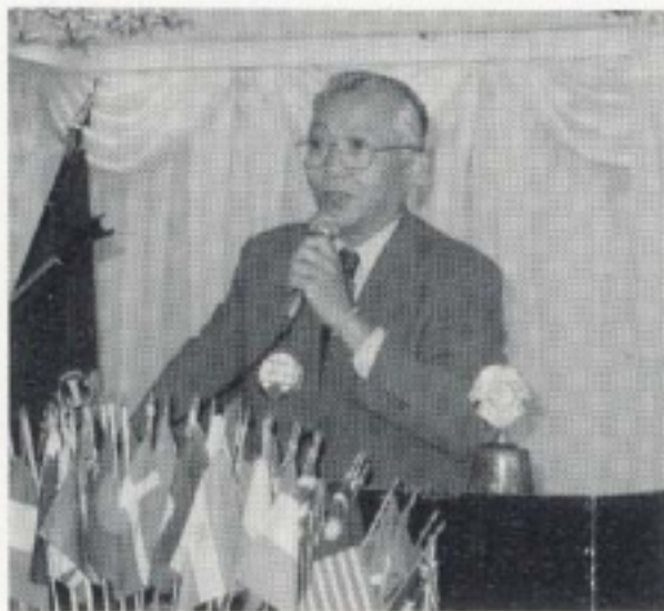
L小山会長挨拶 感謝!