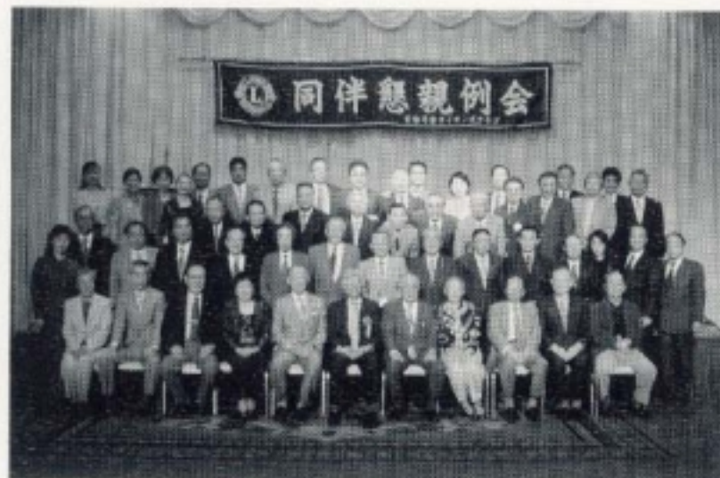
L Lもご一緒に、記念撮影「ハイ、チーズ」