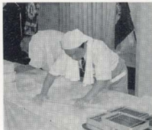
テールツイスター登場!! 蕎麦打ち。現・次期つなぎが大切。