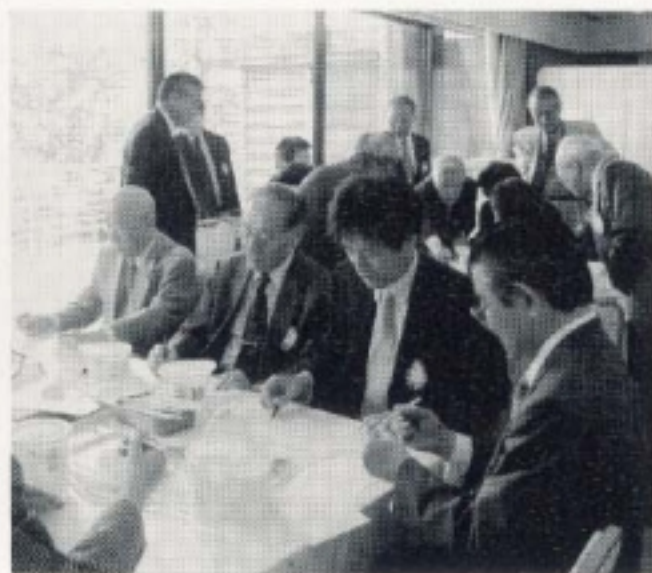
手描き体験紙凧子 (5月第一)