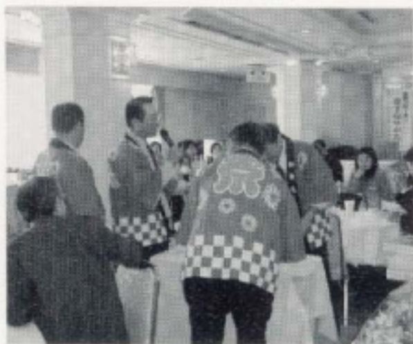
さあ! 事業資金獲得委員長の発声で オークションの始まり~ (12月第一事業資金獲得・バザールオークション)