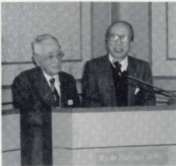
元地区ガバナーの思い出を語っていただきました。 (2月第一 元地区ガバナーを讃える)