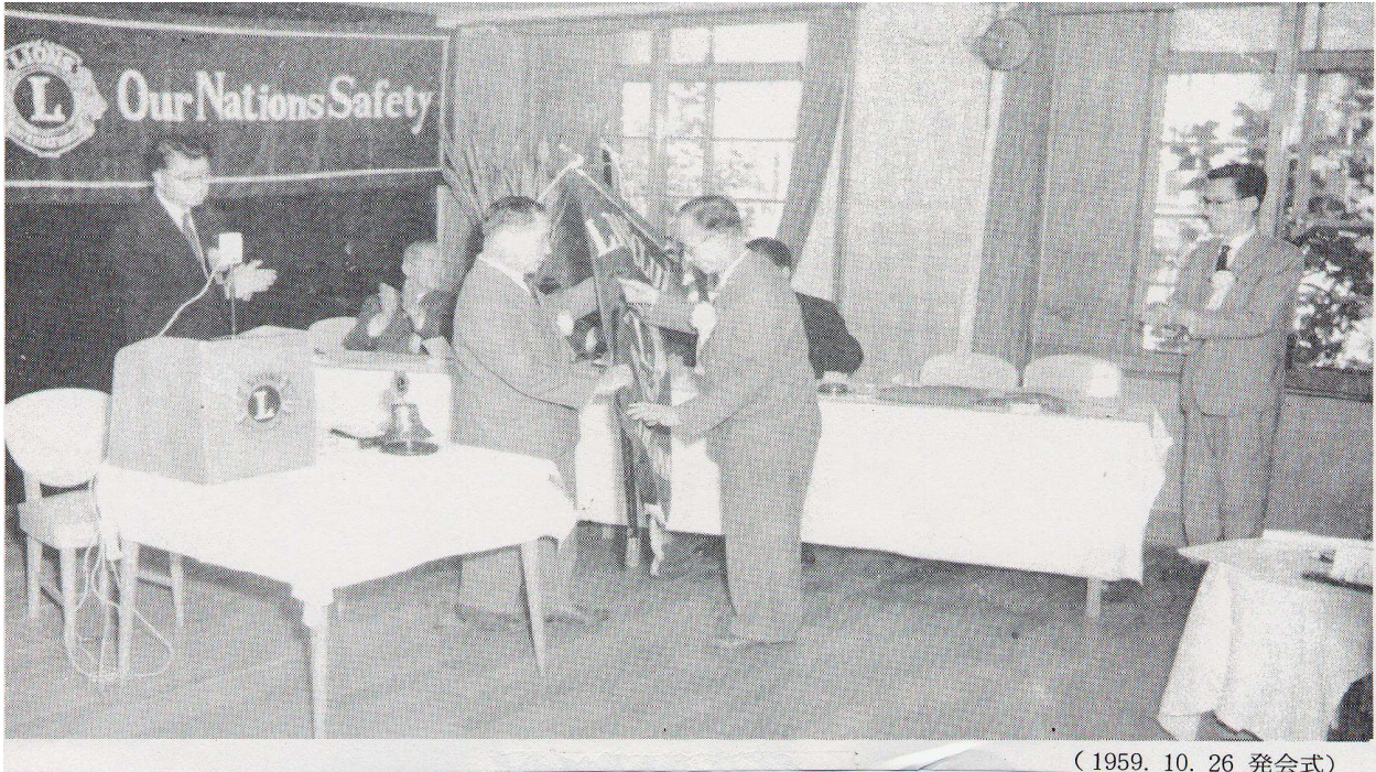
(1959. 10. 26 発会式)